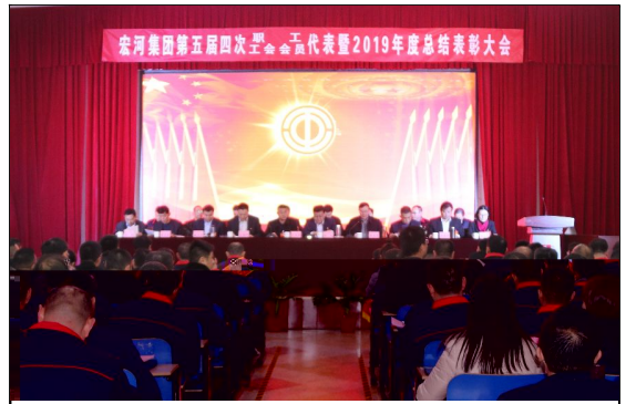
1 a 19日，宏河集团第五届四次职代会（工代会）暨2019年度总结表彰大会在横河煤矿职工bc召开。